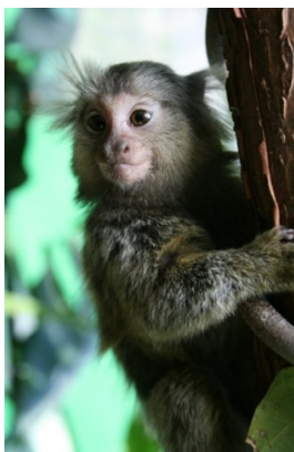
Afbeelding 1: Marmosetaapje

De situatie op het Zuid-Amerikaanse continent wijkt hier echter van af. Tussen 1990 en 2010 zijn 35 gevallen van rabiës bij Braziliaanse marmosetaapjes ( Callithrix jacchus , afbeelding 1), behorend tot de nieuwewereldapen die alleen in Zuid-Amerika voorkomen, beschreven (Agu11). Het bij deze dieren gevonden RABV is in antigenetisch en genetisch opzicht uniek en niet nader verwant aan andere RABV op het Amerikaanse continent. Hiervoor zijn twee verklaringen mogelijk. De apen hebben het virus opgelopen bij een tot nu toe niet nader bekend reservoir óf ze vormen zelf het reservoir (Fav01).