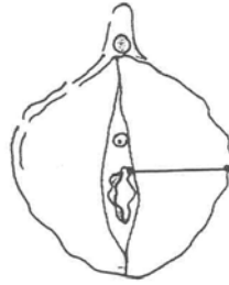
Figuur 15.1. Meten van de labia binnenzijde links (Hage 2008).

In de richtlijn van plastisch chirurgen en gynaecologen voor het uitvoeren van labiumverkleining (Hage 2008), is op grond van wetenschappelijk onderzoek afgesproken dat de ingreep niet wordt verricht bij labia onder een grootte van 40 mm, vanwege onvoldoende verwachting van positief effect op de klachten. Ook wordt de ingreep niet uitgevoerd bij cliënten onder de 18 jaar. Verkleining van de binnenste schaamlippen is in de meeste gevallen een niet-noodzakelijke ingreep in een gezond orgaan dat van belang is voor de vrouwelijke seksualiteit.